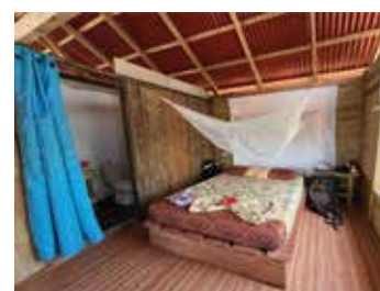
Habitación segundo piso con vista a la playa y balcón