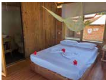
Habitación primer piso con vista a la playa