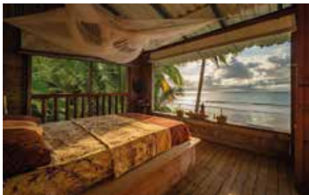
Habitación segundo piso con vista a la playa