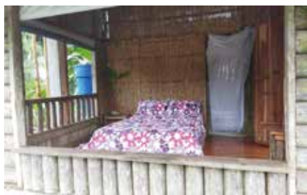
Habitación segundo piso vista a la selva