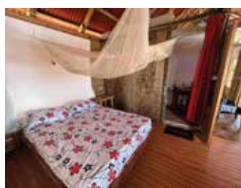
Habitación segundo piso con vista a la playa y balcón